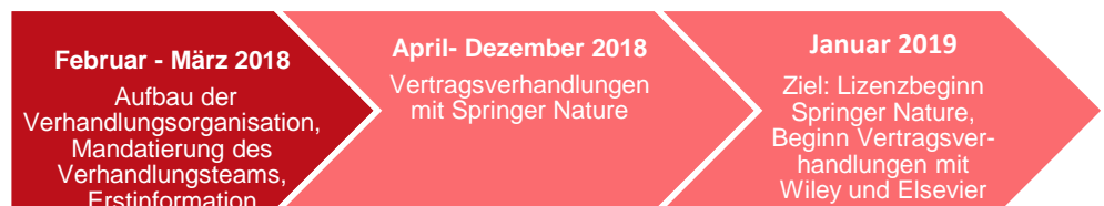
Abbildung 1: Zeitplan

Die Verhandlungsstrategie verfolgt das Ziel, die nationalen Verträge über den Zugang zu wissenschaftlichen Zeitschriften mit den Grossverlagen Springer Nature, Wiley und Elsevier mit Open-Access-Komponenten umzugestalten. Die Verhandlungen sollen zeitlich gestaffelt erfolgen und werden 2018 mit Springer Nature beginnen (vgl. Zeitplan). Die Verhandlungen mit Wiley und Elsevier sind ab 2019 vorgesehen.